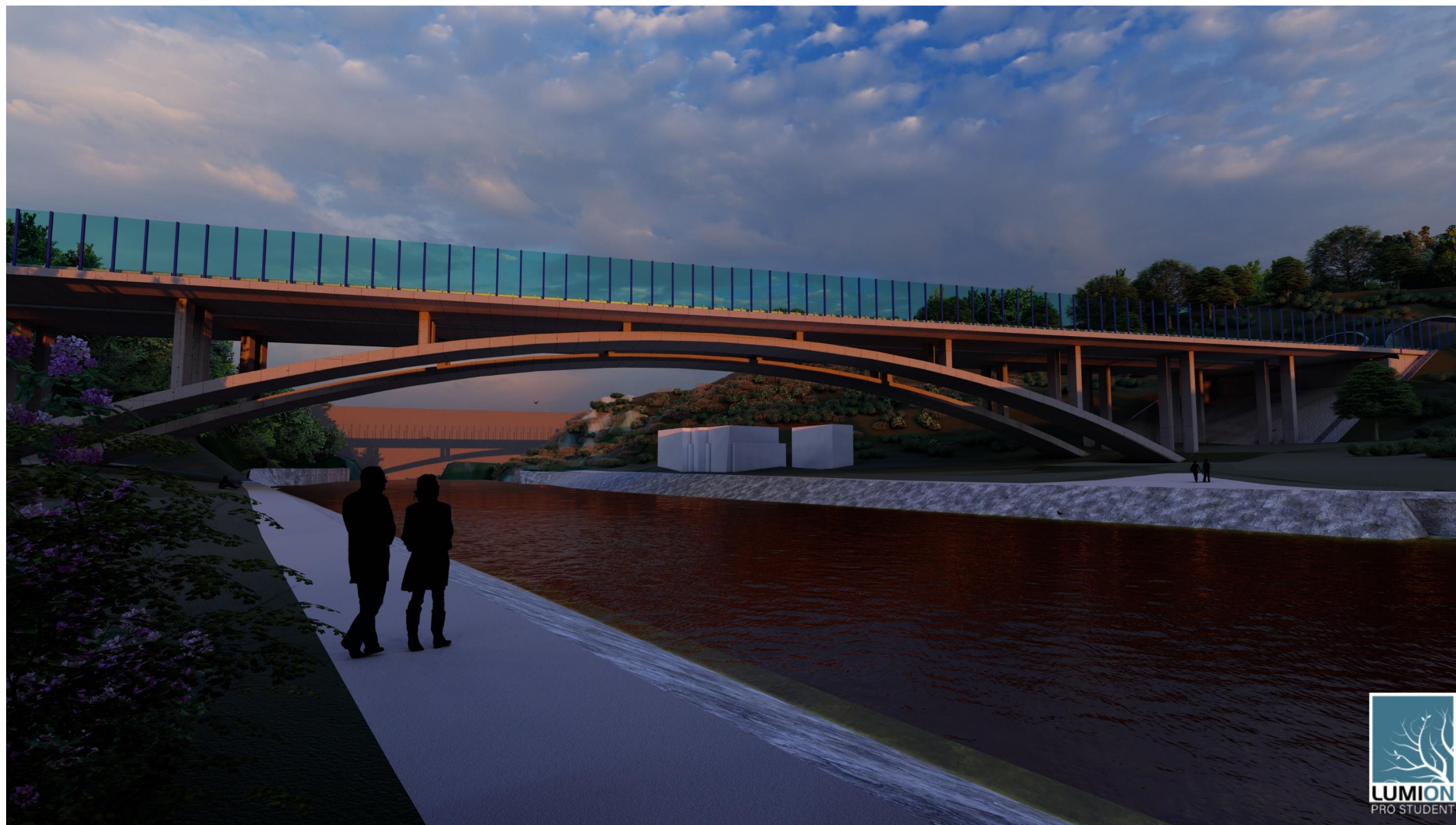
Obr.8.: VEČERNÍ POHLED NA MOST