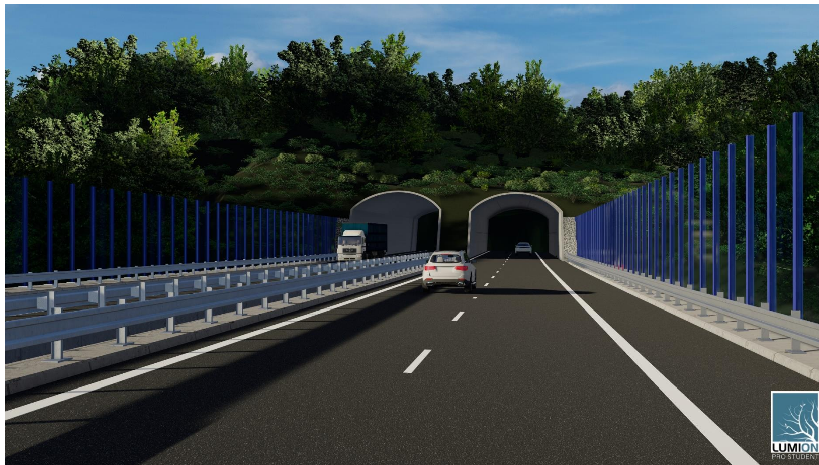
Obr.4.: VJEZD DO TUNELU SMĚR BRNO BYSTRC