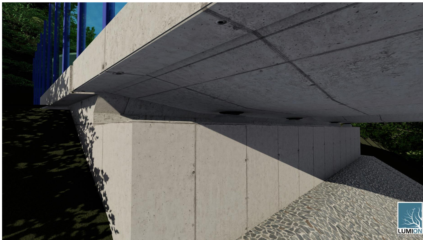
Obr.6.: DETAIL OPĚRY OP1